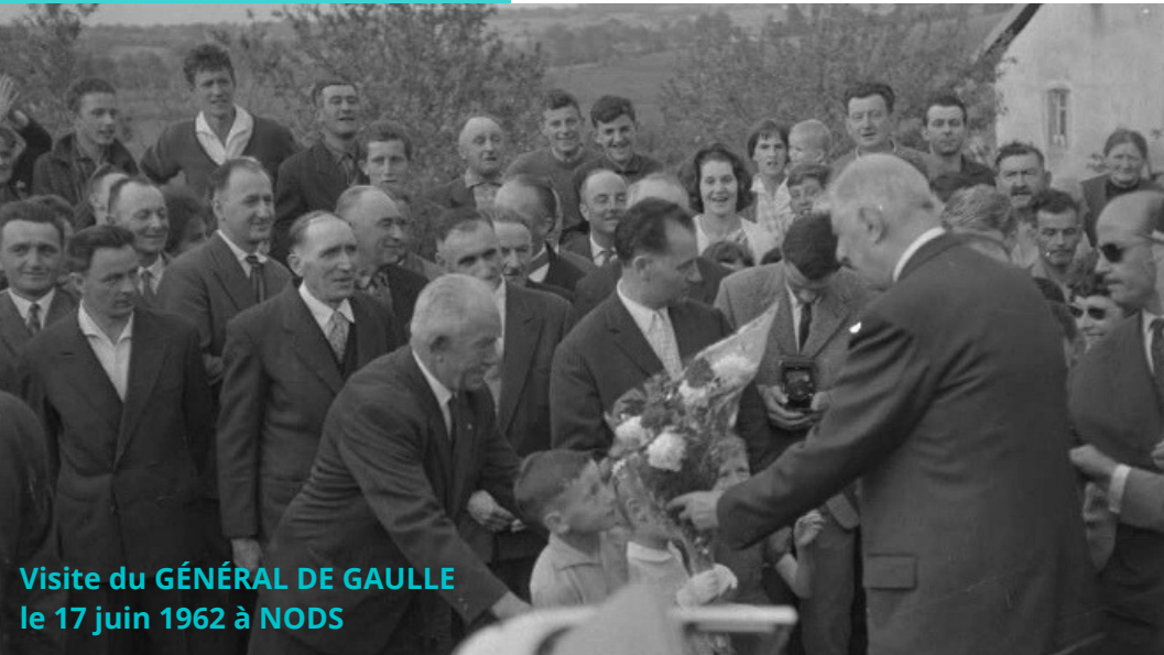
Visite du GÉNÉRAL DE GAULLE le 17 juin 1962 à NODS